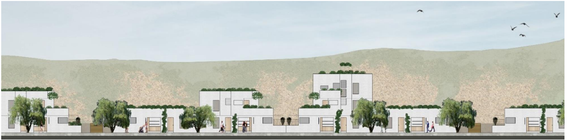
ELEVACION / La vivienda en las 3 fases.