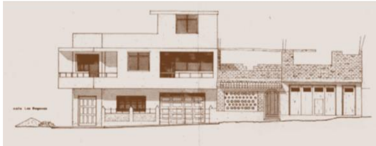
Evolución de la vivienda informal en Lima. Willy Ludeña, 2013