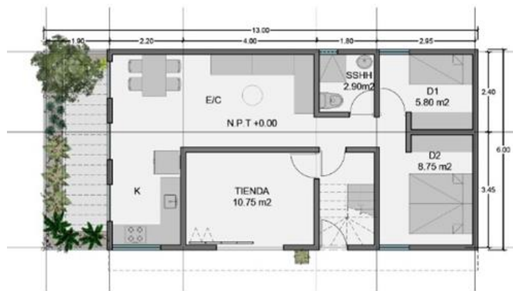
PLANTA 1 72.00 m 2