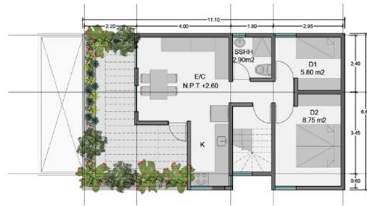
PLANTA 2 67.45 m 2