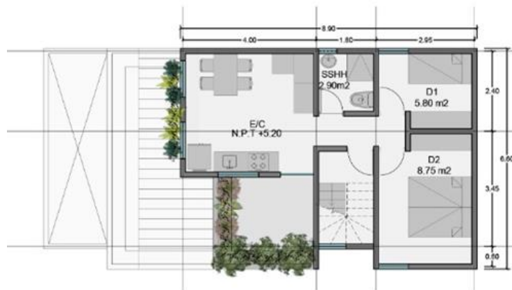
PLANTA 3 50.00 m 2