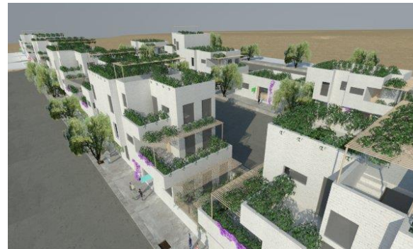
VISTA / Las viviendas adaptadas a un terreno de superficie plana