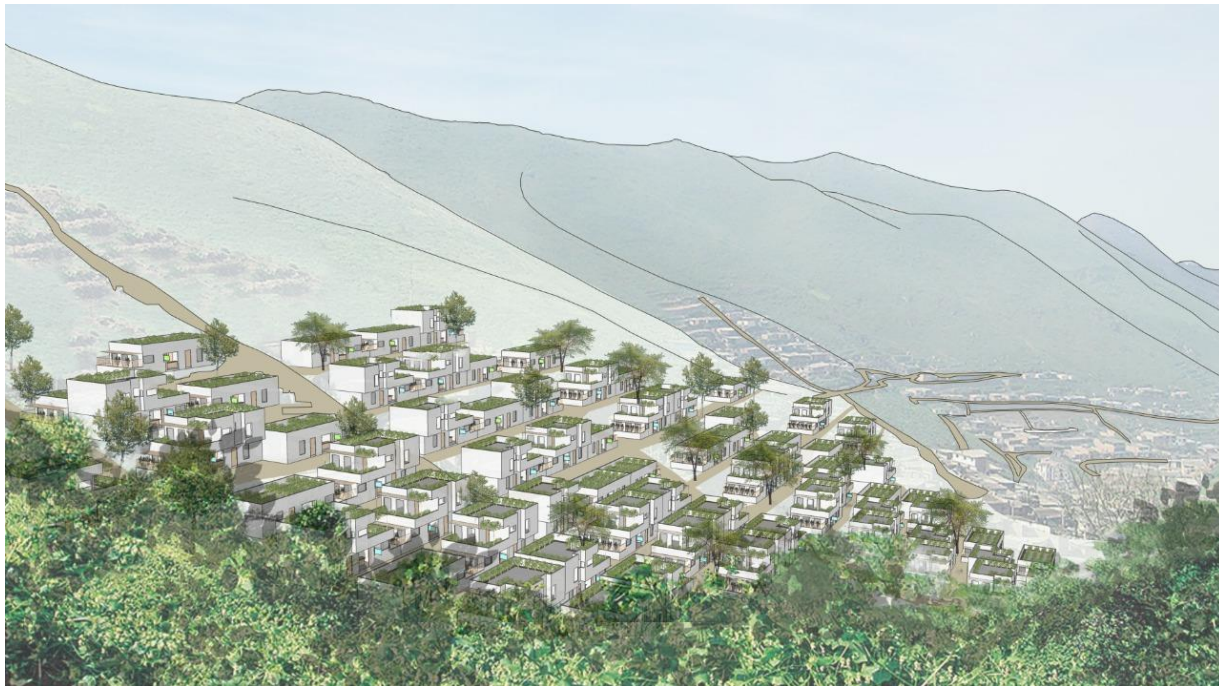
VISTA / Las viviendas adaptadas a un terreno en pendiente